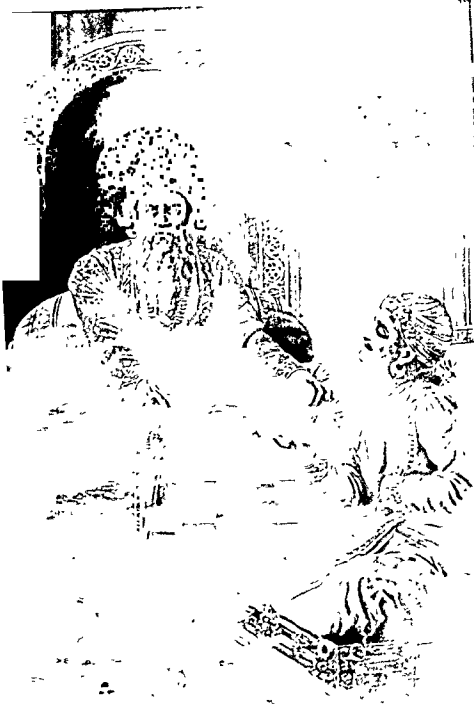
धृतराष्ट्र सजय से युद्धभूमि की घटनाओं के विषय में पूछते हैं। अपने गुरुदेव श्रील व्यासदेव की कृप से सजय धृतराष्ट्र के कक्ष में होते हुए भी कुरुक्षेत्र की युद्धभूमि को देख सकते थे।